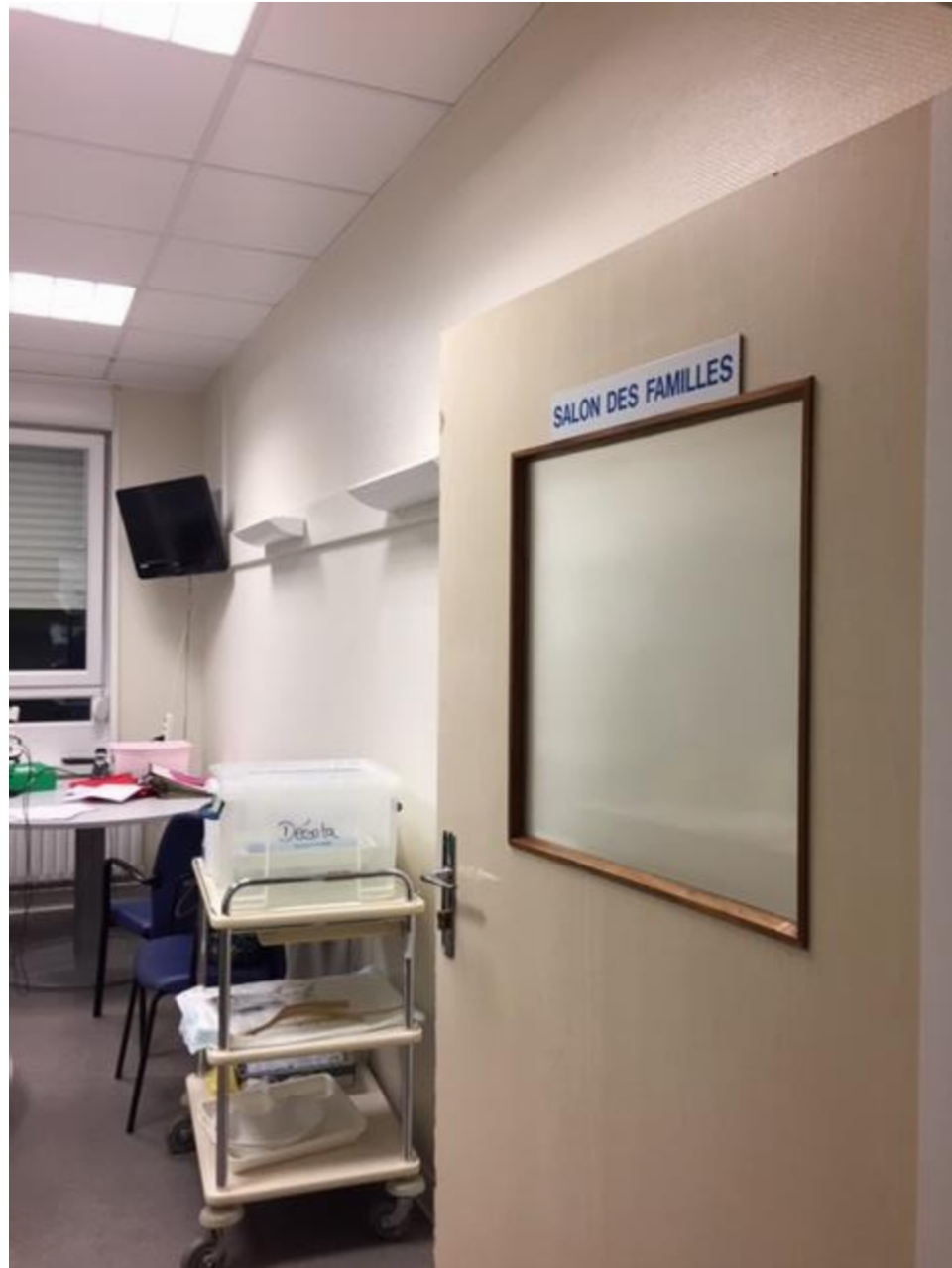
Reunion AMVPPU - 11/03/2020