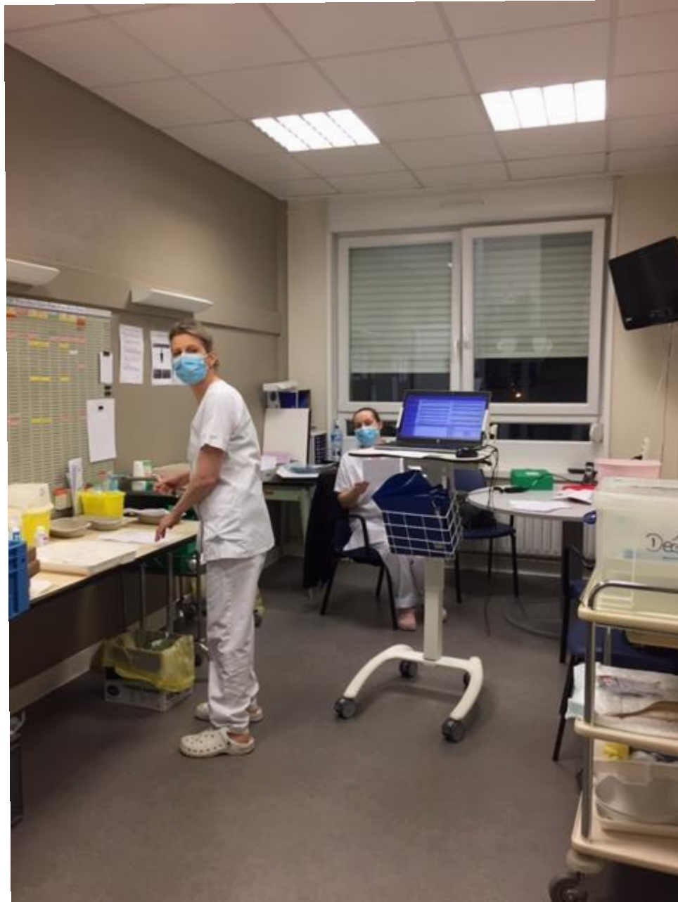
Reunion AMVPPU - 11/03/2020